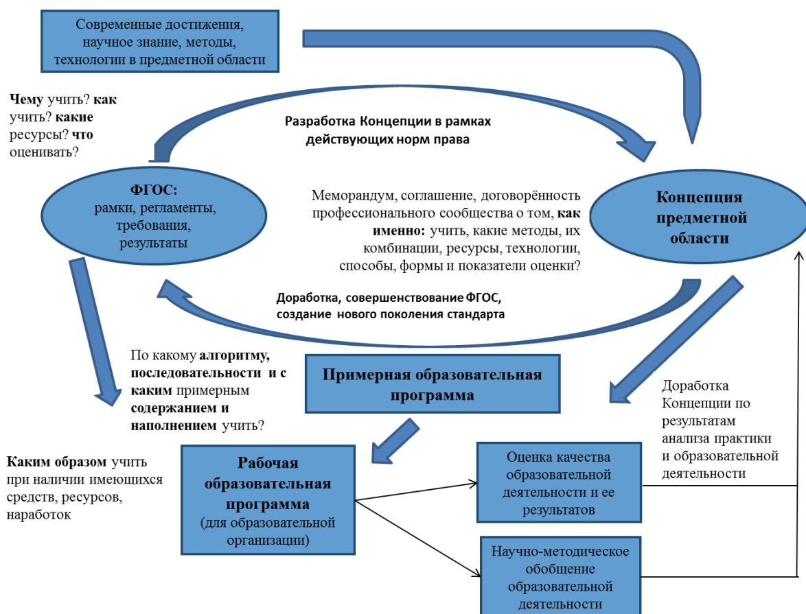
Рисунок 1. Типовая схема взаимовлияния ФГОС, концепции предметной области (учебного предмета), Примерной образовательной программы

В предложенной схеме действует несколько уровней оценки и обратной связи. В-первых, это ФГОС и Концепция, которые в процессе итерации способствуют совершенствованию друг друга. Концепция так же дорабатывается на основе современных достижений и технологий обучения, а так же за счёт обобщения практических результатов обучения – и той «обратной связи», которая получается от профессионального сообщества.